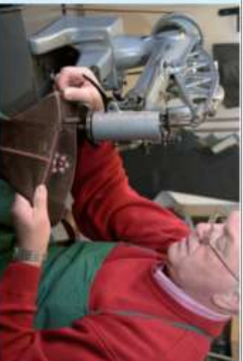
Beim Schäfte nähen

von Reparaturen aller Art in eigener Werkstatt