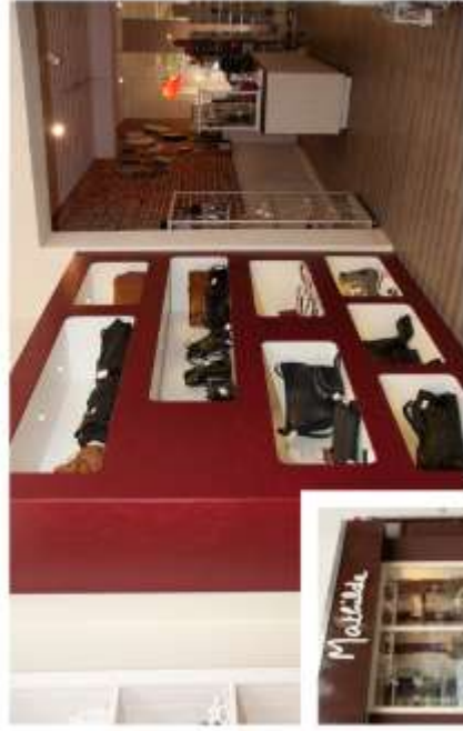
Ladeneinrichtung Mathilde – Geschenke & mehr ...

Innenusbau · Laden-Einrichtungen sowie Messebau nach Maß