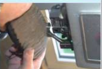
Eigene Durch- nämaschine